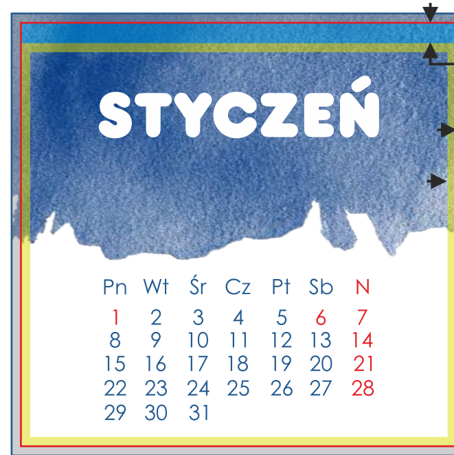
STRONY Z MIESIĄCAMI 170x160 mm (ze spadami 176x166 mm)

obszar spiralowania 11mm spad 3mm bezpieczny margines 2mm